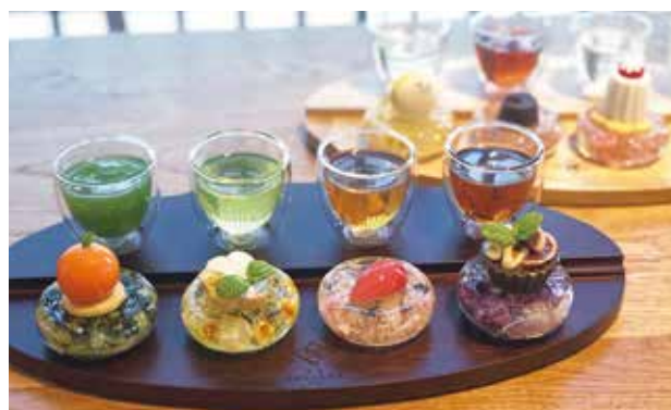
人気メニューの「ティーペアリングセット」