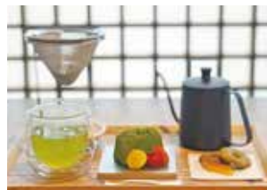
「マイドリップティー 緑茶ブレンド 茶菓子付き」と「深蒸しショコラ 宇治抹茶」