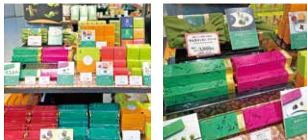
※バレンタインチョコの写真は、昨年のものであります。