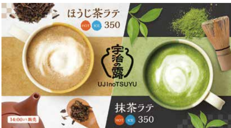
抹茶ラテ、ほうじ茶ラテのイメージビジュアル

先方のご担当者様には、福寿園グループの各施設でお茶の知識を得ていただいたり、レシピやお茶の専門知識の