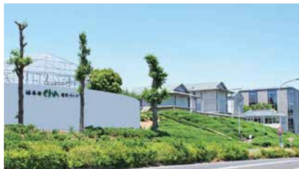
緑豊かな茶園に囲まれた福寿園CHA遊学パーク内で働いています。