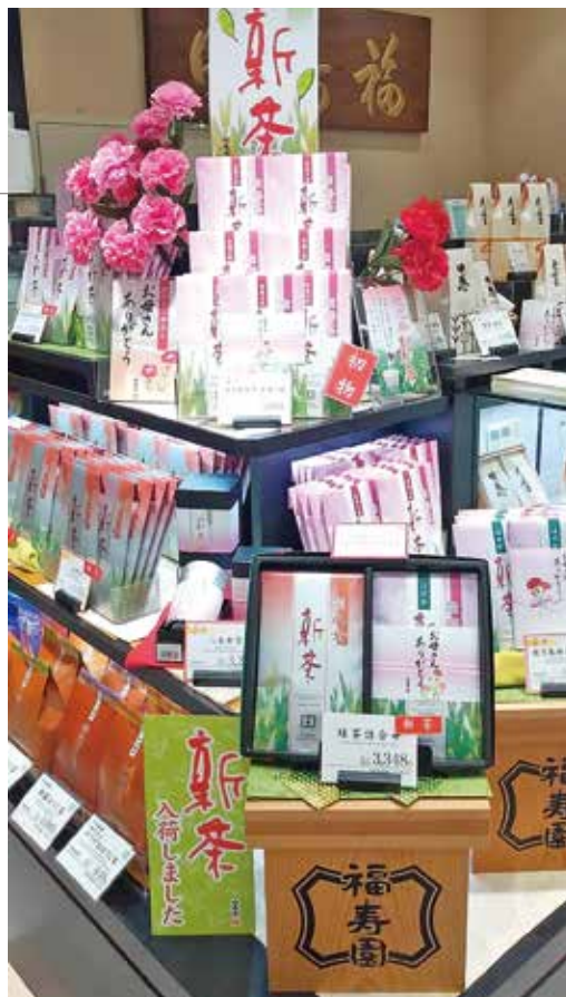
※写真は、昨年のものです。

福寿園松坂屋上野店(松坂屋上野店B1F)は、地元の常連のお客様にご愛顧いただいているお店で、毎年新茶の発売と同時に、「今年の新茶はどんなお味かしら。楽しみに待っていました!!」とお声がけしていただいております。最近、茶殻の処理が簡単で便利と、茶葉からティーバッグタイプに移行されるお客様も多く、「宇治新茶 若葉の風」、「鹿児島新茶 若葉の風」ティーバッグ4g×8袋入が好評で、今年は「宇治新茶 若葉の風」の20袋入が新発売予定です。母の日(5/8)のプレゼントにも新茶のギフトがおすすめです。