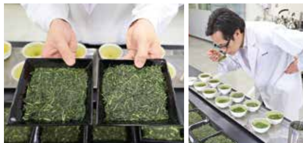
試作実験室にて官能審査の様子

ドリンク原料茶に携わることで培ったお茶の生産技術と、現在の仕事を担当する以前に当社工場の製造現場で学んだ経験を活かして、今後は社内連携をとって福寿園グループの新商品開発や飲食店メニューなどの新しいお茶を提案し、話題となるような情報発信に繋げていきたいと考えています。