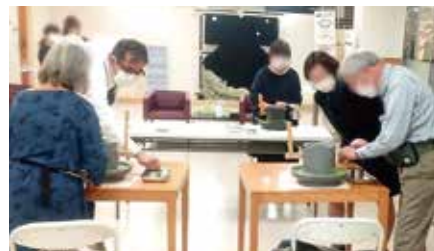
抹茶・ほうじ茶サンデー 石臼体験の様子

福寿園公式Instagramでは、催事情報を随時投稿しております。ストーリーズでも催事の様子などが、随時ご覧いただけますので、ぜひフォローをお願いします。