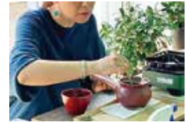
ほうじ茶づくりの様子

自慢のお茶を使ったドリンクの販売と野外で楽しむ自家製ほうじ茶づくりとほうじ茶のアレンジ体験を実施しました。