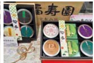
迎春におすすめのパラエティーギフト