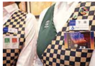
スタッフが自信をもっておすすめする商品を胸名札でPR

チーフを任されて約10年が経ちました。その間、「お客様に寄り添った優しい接客ができるお店にしよう！」と心がけてきましたので、当店は、接客サービスには自信があります。当店で接客やワークショップのスキルを学んだスタッフが同じエリアの他店舗のチーフとして活躍したり、現在は、他店舗で開催するワークショップのサポートに向かいたりもしています。今後は、将来に向けて店舗運営や人材育成により力を入れていきたいと考えています。さらに福寿園のお茶の価値を高め、選ばれる福寿園であり続けられるように、SNSを使った情報配信など新たなことにも挑戦し、西日本での福寿園の価値を高めていきたいと考えています。