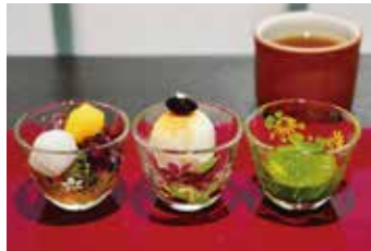
石臼挽き濃茶の宇治茶アフォガード ミニあんみつ・ほうじ茶付(茶房Adonis福寿草)