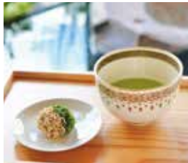
薄茶と和栗さんどん(京都本店4階)

10/26wed ~ 11/8tue 福寿園京都本店 4階「京の茶庵」、 茶房Adonis福寿草、茶寮FUKUCHA四条店 イベント限定メニューや特典付きメニューをご提供しました。