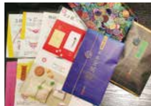
水引き細工のテキストと装飾例