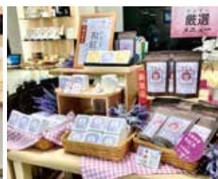
当店限定の新品「ラベンダー和紅茶 ティーバッグ」