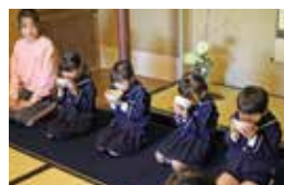
抹茶を楽しむ園児ら