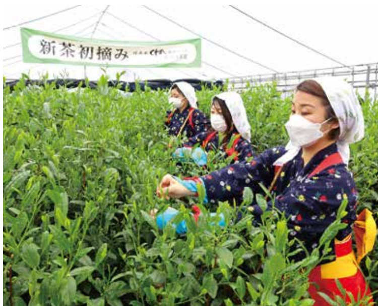
初摘み行事の様子

一足早く、新緑の息吹“新茶”を楽しんでいただきたいと、CHA遊学パークの温室茶園で栽培した新茶の初摘みを、茶摘み娘の衣装を着けた弊社社員が行う「初摘み行事」に合わせ、本年は日頃より弊社をご利用いただいている方限定のイベント「春のCHA感謝祭」を開催いたしました。約100名様にお越しいただき、通常は実施していないお茶の体験や、喫茶などのコンテンツをお楽しみいただき、「大人が存分に楽しめる施設ですね。」や、「お茶の様々な楽しみ方が体験できて有意義でした。」などのお声をいただきました。 来年以降も「初摘み行事」に合わせ、「春のCHA感謝祭」を実施していく予定です。