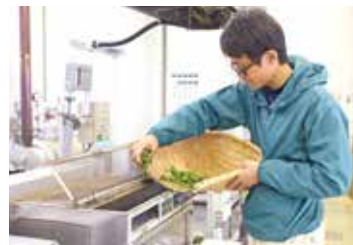
CHA機械製茶体験の一場面

新茶は、フレッシュな香りが楽しめるお茶なので、少し熱めのお湯で淹れて香りを楽しむのがおすすめです。採れたての新茶が一番香り良いので、発売されたらすぐにご購入いただき、開封後も早めに召し上がっていただくことをお勧めいたします。