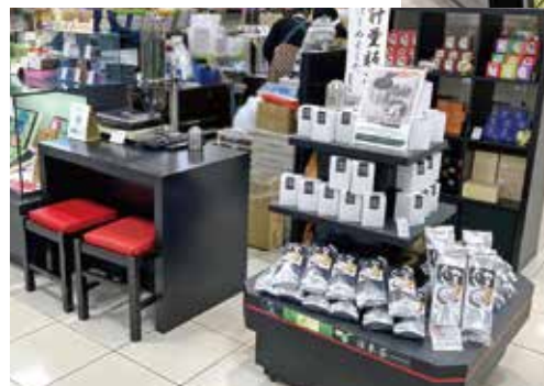
接客台に設置された計量販売のお茶(左側)