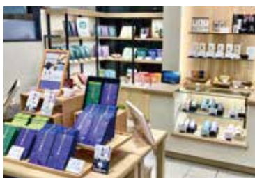
こだわりのお茶を厳選