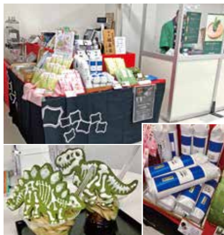
恐竜のお茶クッキーをトッピングした「抹茶・ほうじ茶サンデー」