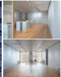
アートスペース福寿園 フロアイメージ

《Camellia sinensis #1》2024年 キャンバス、油彩 ©Sayaka Toda, courtesy Art Space FUKUJUEN / KANA KAWANISHI GALLERY