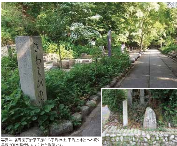
写真は、福寿園宇治茶工房から宇治神社、宇治上神社へと続く早蕨の道の路傍に立てられた歌碑です。

巻名は、中君が詠んだ和歌「この春は誰にか見せむ 亡き人の形見に摘める 嶺の早蕨」に因むとされています。もうこの世にはいない父、そして姉への思いが託されています。