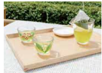
水出し新茶のイメージ

気候や気温、気分、体調によって淹れ方を変えることも、お茶の醍醐味といえるでしょう。ぜひ新茶をきっかけに楽しみ方を広げてみませんか。